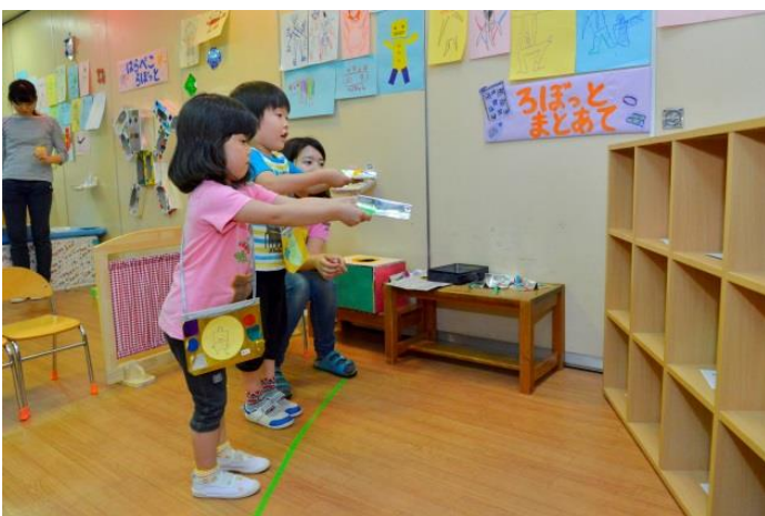
的あてです。輪ゴムの鉄砲で自分たちが描いたロボットの 絵を倒します。うまく当たるかな…？