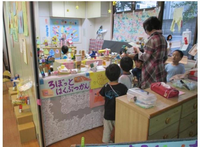
みんなの作ったロボットをお部屋のあちこちに 並べます。