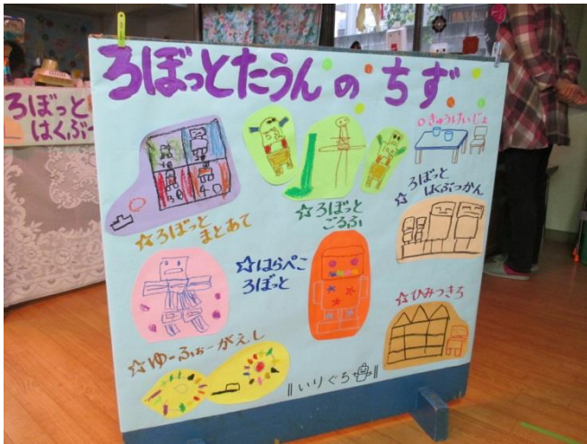
空き箱工作のロボットたちが集まる世界 「ロボットタウン」をつくることになりました！