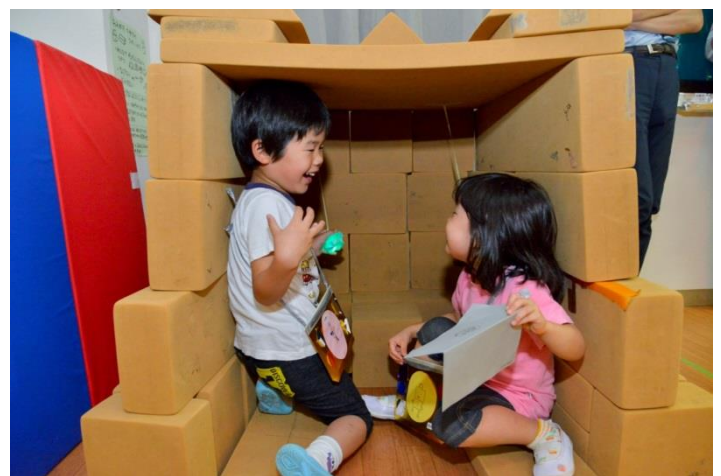
隠れ家のような「ひみつきち」も作りました。