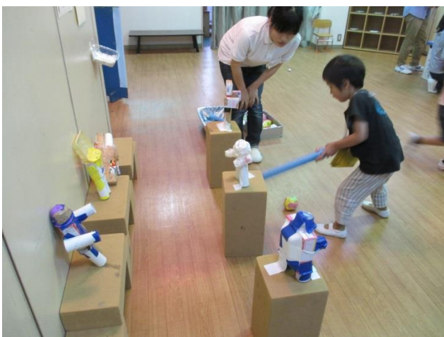
ゴルフゲームにもロボットが…！！