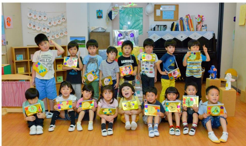
上ノ原幼稚園 お泊まり保育 2015年6月18日