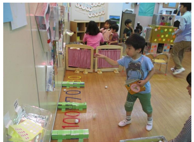
壁に飾られたロボットに向かってボールを投げて 遊びます。うまく穴に入るかな？？

子どもたちが日ごろから楽しんでいる遊びが広がって、お泊り保育での「お楽しみ」の世界が出来上がりました。 みんなでアイデアを出し合いながら、遊びや活動を展開しています。